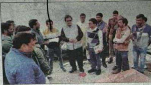
तिगरी में गंगा घाट का पर्यटन अधिकारी, विधायक व अन्य।